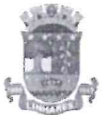
imagem em anexo que justifica tal demanda.

Entendemos que se trata de assunto urgente , por isso, tal proposição merece endereçamento imediato por parte da Prefeitura Municipal.