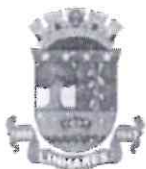
imagem em anexo que justifica tal demanda.

Entendemos que se trata de assunto urgente , por isso, tal proposição merece endereçamento imediato por parte da Prefeitura Municipal.