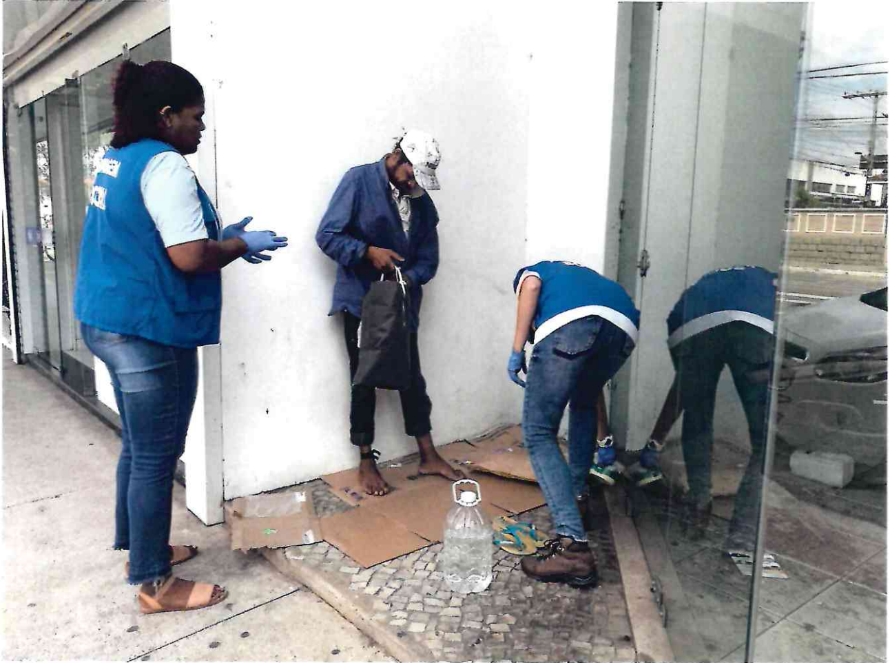
Abordagem próximo a Ótica Linhares