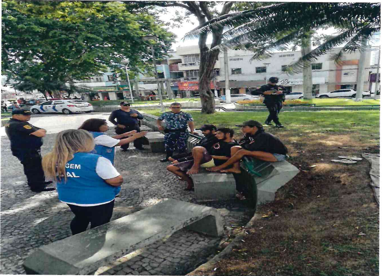
Abordagem Praça Nestor Gomes