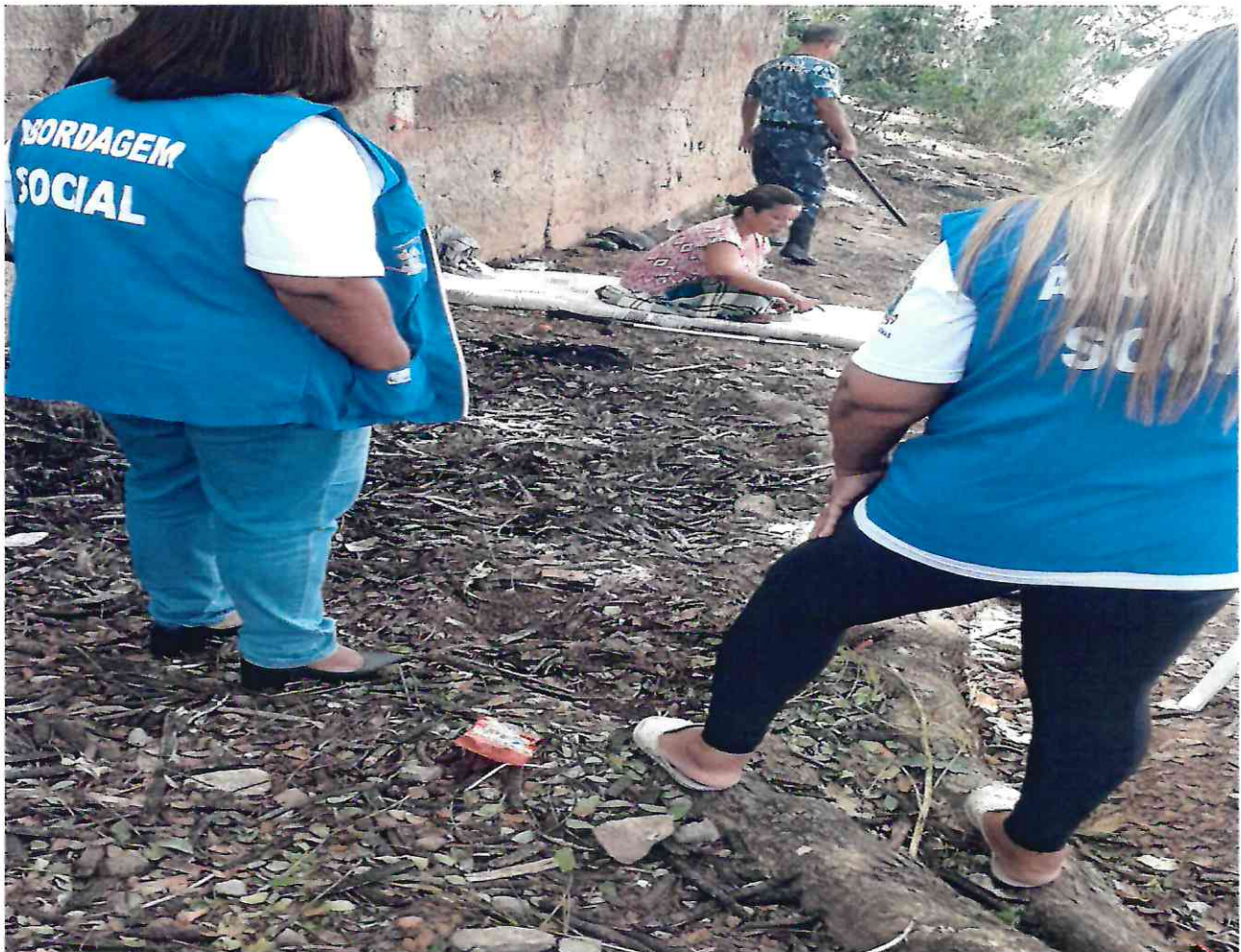
Abordagem no Cais do Porto do Rio Doce