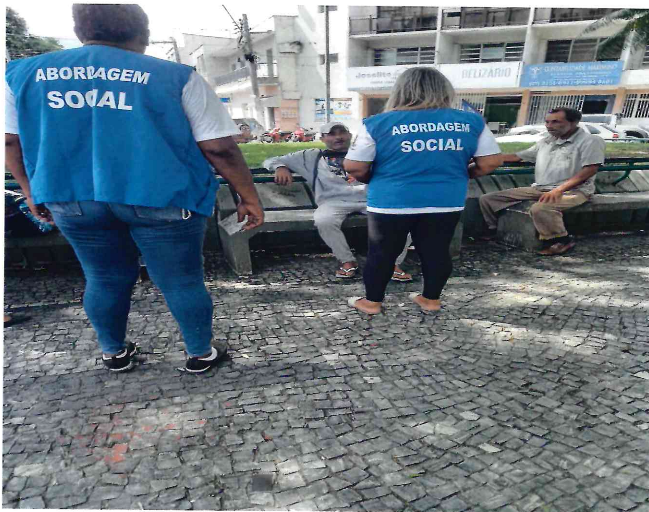
Abordagem Praça Nestor Gomes