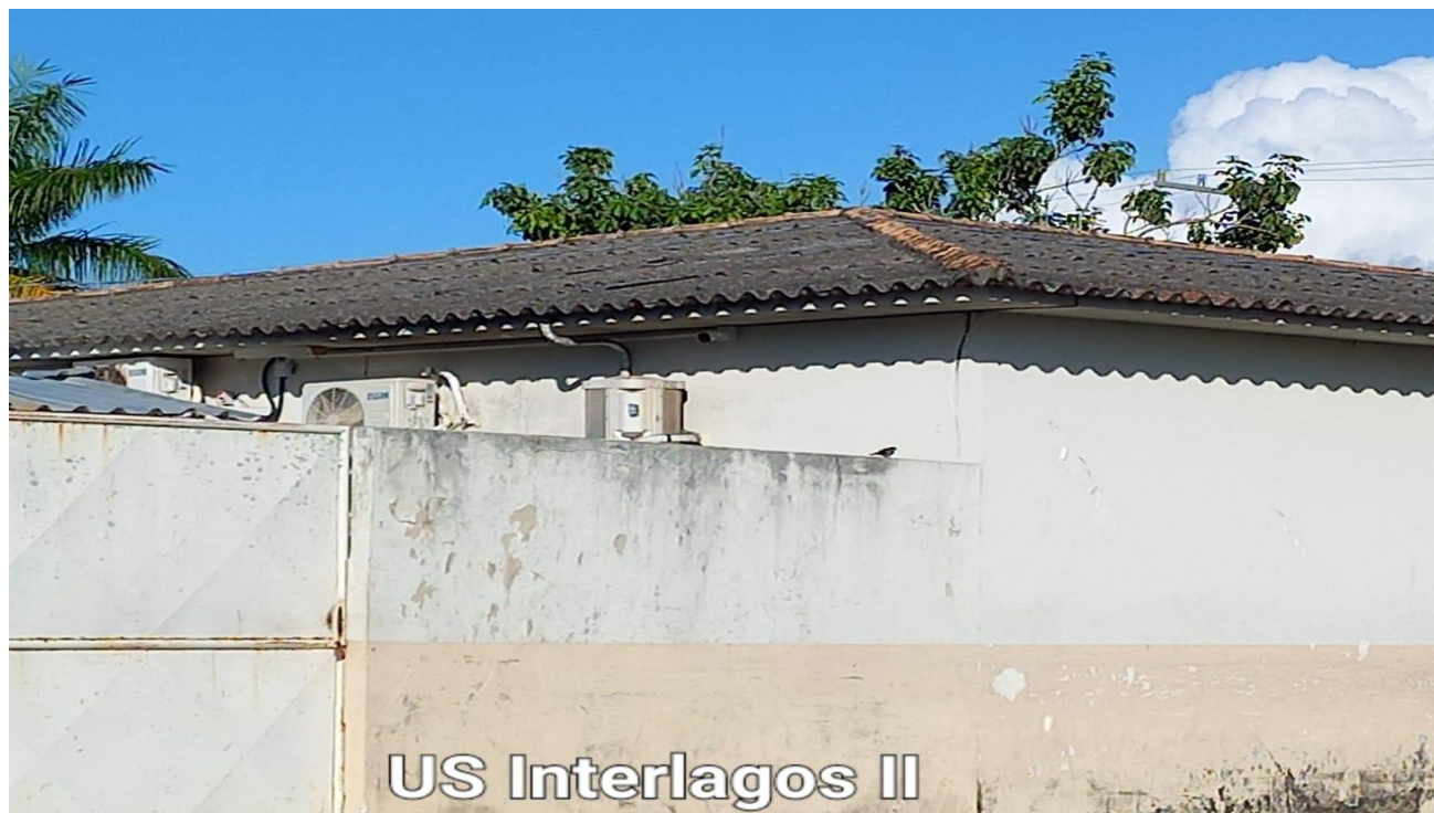
US Interlagos II