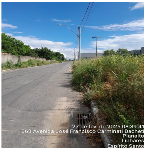
27 de fev. de 2025 08:39:41 1368 Avenida José Francisco Carminati Bacheti Planalto Linhares Espírito Santo