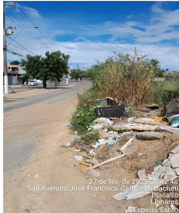
27 de fev. de 2025 08:42:48 548 Avenida José Francisco Carminati Bacheti Planalto Linhares Espírito Santo