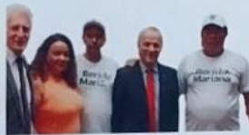
Deputado federal Helder Salomao do Espírito Santo, e Deputado Rogério Correia de Minas Gerais.